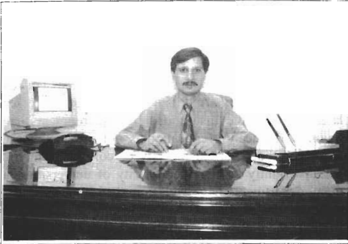
Principal the purpose of their visit.