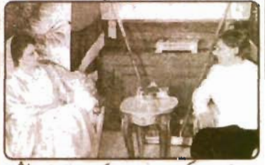
ڈھاکہ: امریکی نائب وزیر خارجہ کرستینا روکا بگلو دیشی وزیراعظم خالدہ خضاء سے ملاقات کر رہی ہیں

امریکی فوج کی تعیناتی: امریکہ نے ترکی سے وضاحت طلب کر لی ترکی کے ساحل کے قریب جنگی جہازوں میں سوار امریکہ کے جہازوں کو فوجیوں کو اتارنے کی اجازت ملنے کا انتظار انقرہ (ریڈیو رپورٹ، ایجنسیاں) ترکی کی پارلیمنٹ نے امریکی فوجوں کو عراق پر جنگی کارروائی کے سلسلے میں ترک سر زمین استعمال کرنے کی اجازت دینے یا نہ دینے متعلق امریکا نے ترکی سے وضاحت طلب کی ہے۔ گزشتہ روز انقرہ میں سپر سکس میں پہنچنے کیلئے پاکستان کو زہمیا بوسے کیخلاف سخت ترین مقابلے کا سامنا ہوگا کراچی (جنگ نیوز) ورلڈ کپ کرکٹ ٹورنامنٹ میں پاکستان کو سپر سکس مرحلے میں پہنچنے کیلئے زہمیا بوسے کیخلاف سخت ترین مقابلے کا سامنا ہوگا۔ پاکستان مشکل کو زہمیا بوسے کے خلاف اپنا پہلا کا آخری سچ کھیلے گا۔ سپر سکس مرحلے میں پہنچنے کے لئے ضروری ہے کہ پاکستان کو اس سچ میں ہماری صفحہ 11 بجے نمبر 20